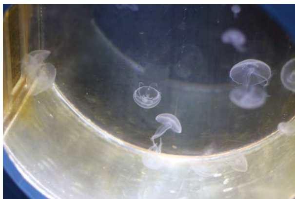
忍野八海に生息する魚たち・・・何と淡水クラゲも！