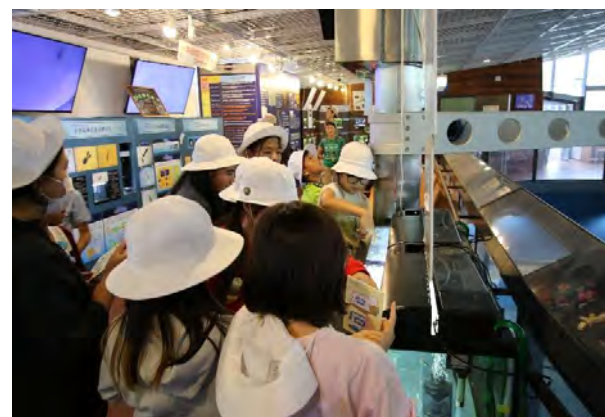
ドクターフィッシュの展示もありました。「くすぐったい！」という声が・・・↑