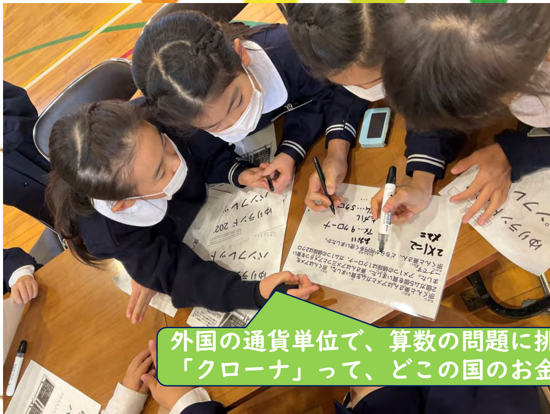
外国の通貨単位で、算数の問題に挑戦！ 「クローナ」って、どこの国のお金だろう。