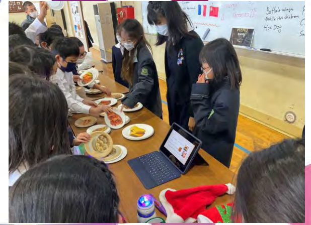
食べ物を紹介するワールドレストラン也大盛況！